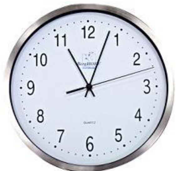
Zegar ścienny na baterię