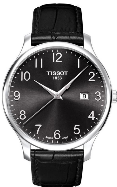
Zegarek na rękę na baterię