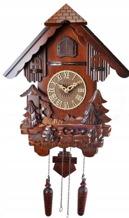
Zegar z kukułką