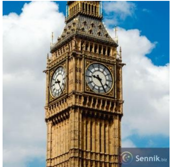
Zegar na budynku, wieży