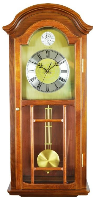
Zegar z wahadłem