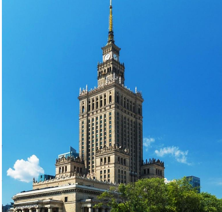
To Pałac Kultury i Nauki

Popatrzcie na budowle znajdujące się w naszej stolicy: