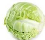
Kapusta biała, czerwona i pekińska