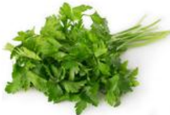
Natka pietruszki (z gruntu)