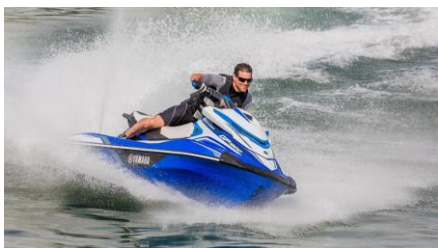
Skuter wodny towarowy