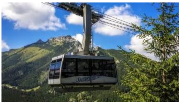
Wyjechać kolejką na Kasprowy Wierch