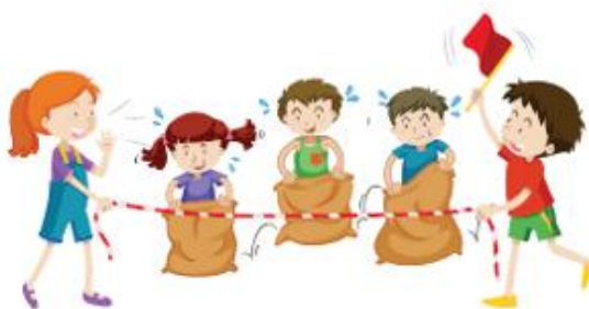
Wyścigi w workach