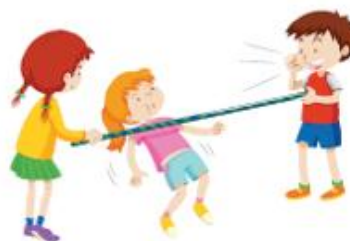
Przejście pod liną

Pozdrawiamy rodziców i mocno ściskamy dzieci.