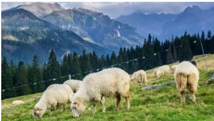
Górskie hale z owcami