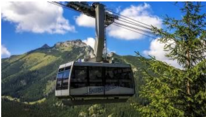
Wyjechać kolejką na Kasprowy Wierch