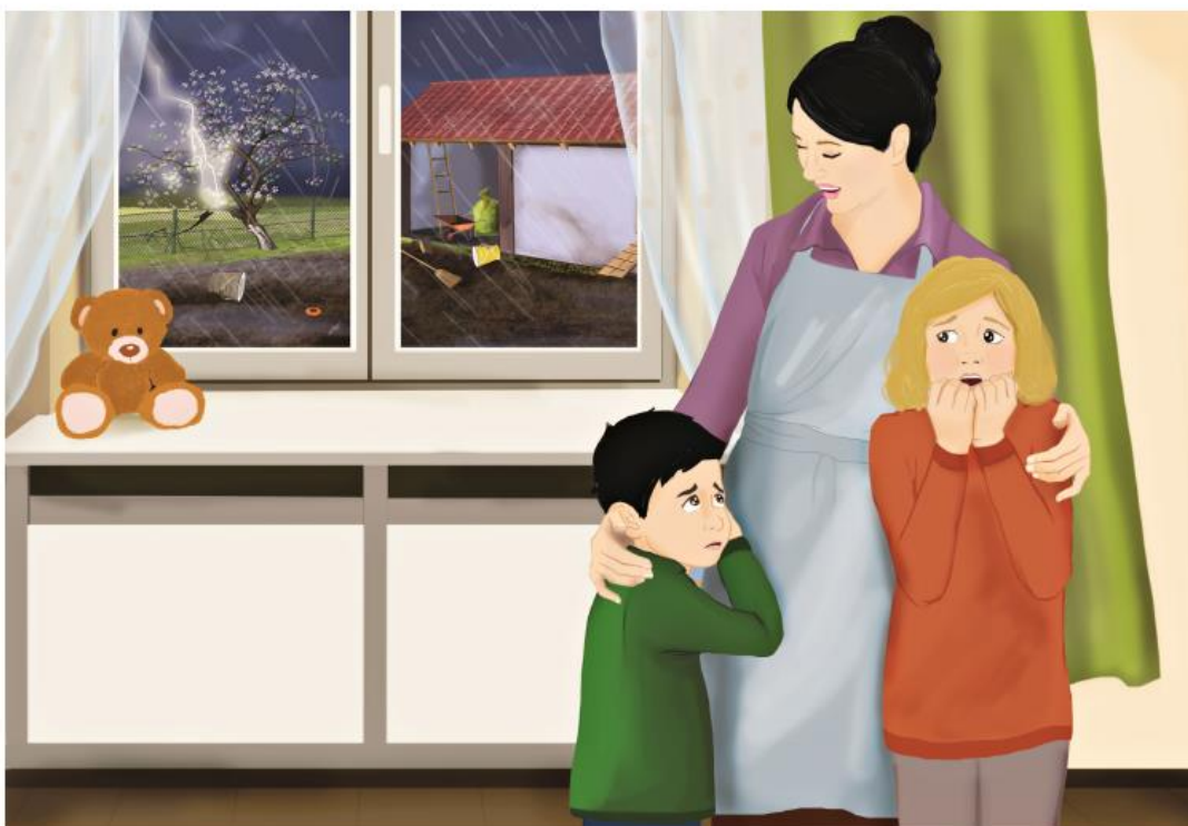
Portret cyfryczna stanowi integralną część scenariusza zajęć z numeru 3.198 marzec 2018 miesięcznika BURZEJ PRZED SZKOŁĄ – materiały na kwiecień. Rysunki i zdjęcia chronione są prawami autorskimi – kopiowanie, odroczytał, dystrybucja w internecie lub wykorzystywanie w innych celach niż poszerzono jest niedozwolone.