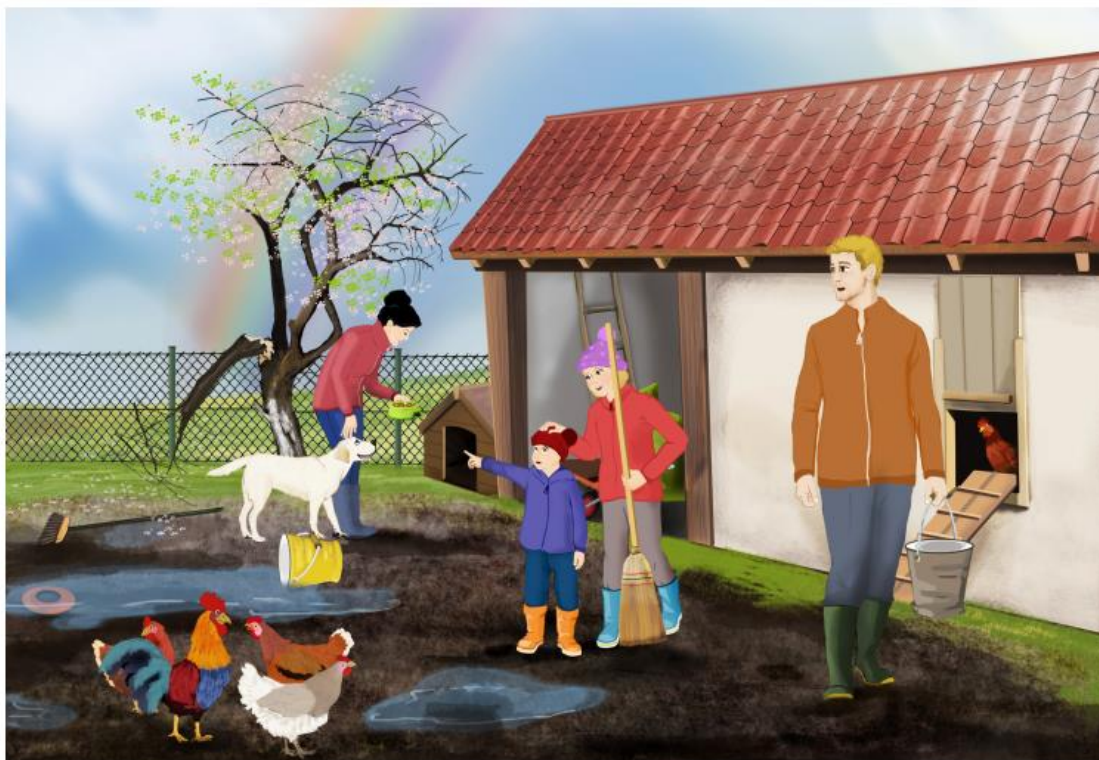
Portret cyfryczna stanowi integralną część scenariusza zajęć z numeru 3.198 marzec 2018 miesięcznika BURZEJ PRZED SZKOŁĄ – materiały na kwiecień. Rysunki i zdjęcia chronione są prawami autorskimi – kopiowanie, odroczytał, dystrybucja w internecie lub wykorzystywanie w innych celach niż poszerzono jest niedozwolone.