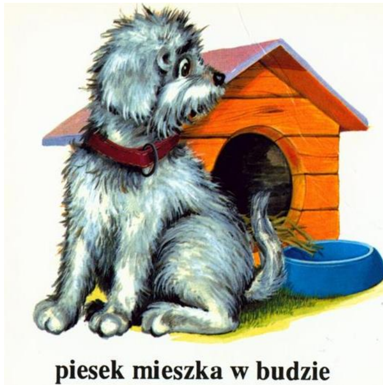
piesek mieszka w budzie