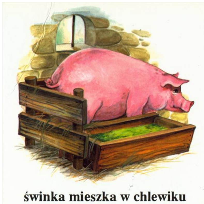
świnka mieszka w chlewiku